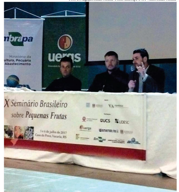
Um dos painéis tratou sobre gestão.

O IX Seminário Brasileiro sobre Pequenas Frutas foi promovido pela Embrapa Uva e Vinho, Embrapa Clima Temperado, Emater-RS/Ascar, Prefeitura Municipal de Vacaria, Instituto Federal do Rio Grande do Sul (IFRS), Universidade de Caxias do Sul (UCS), Universidade do Estado de Santa Catarina (UDESC) e Universidade Estadual do Rio Grande do Sul (UERGS). Também contou com o apoio da Fundação de Amparo à Pesquisa do Estado do Rio Grande do Sul (Fapergs) e da Corsan.